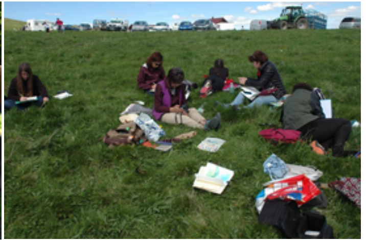
Photos : transhumance à Giromagny 2017

Stage les matins et après-midi entrecoupé de marches, pique-nique si le temps le permet et bons repas le soir. Débutants acceptés.